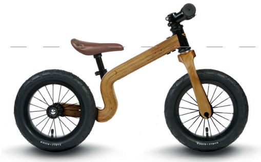
Laufrad „Bonsai“ von Early Rider, Großbritannien, 2015. Running bike „Bonsai“ by Early Rider, Great Britain, 2015

Good design and safety are consistent with this impeller. This makes it easy for the youngest to get into cycling. The bicycle allows everyone access to mobility – regardless of age, personal fitness or physical ability.