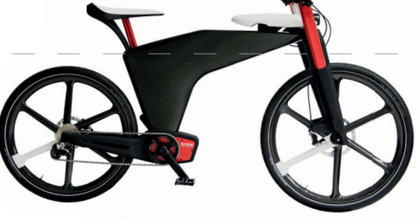
Prototyp „Visionsbike“ von Brose, Deutschland, 2015 Prototype „Visionsbike“ by Brose, Germany, 2015

Bicycle visions, developed, among others, by large automotive suppliers, are only one hint at the development potential that can be found in the bike. Wood, bamboo or high-tech materials, alternative drives or digital networking: We have great expectations to the bicycle of the future.