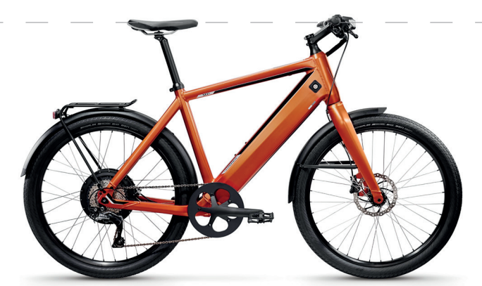
E-Bike „ST1 X“ von myStromer AG, Schweiz, 2014/16 E-Bike „ST1 X“ by myStromer AG, Switzerland, 2014/16

The new E-bike generation is perfect for longer commutes. They need to be recharged less often and can cross even longer distances without any great effort.