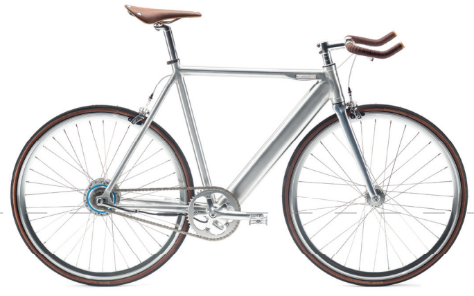
Herrenrad „ONE Soho“ von Coboc, Deutschland, 2016 Men's bicycle „ONE Soho“ by Coboc, Germany, 2016

Design and innovation often go hand in hand. Many bicycle manufacturers provide exclusive and customised bikes with reduced shapes, new frame constructions, noticeable and individual detailed solutions that make the heart of any bicycle enthusiast beat faster.