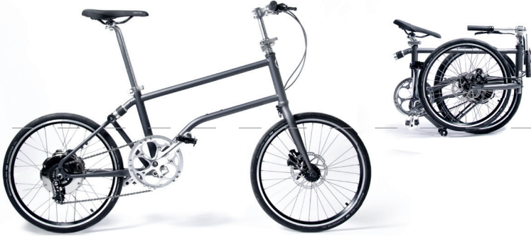
Faltrad „Vello urbano“ von VELLO BIKE, Entwurf: Valentin Vodev, Österreich, 2014 Folding bike „Vello urbano“ by VELLO BIKE, Design: Valentin Vodev, Austria, 2014

Modern folding bikes have nothing in common with the 1970s folding bikes anymore. They can be folded in or out very quickly, which makes them ideal companions for commuters switching between different means of transport. Iconic, with all comfort or with self-recharging motors: they all must be compact and lightweight to be taken into trains, homes or offices.