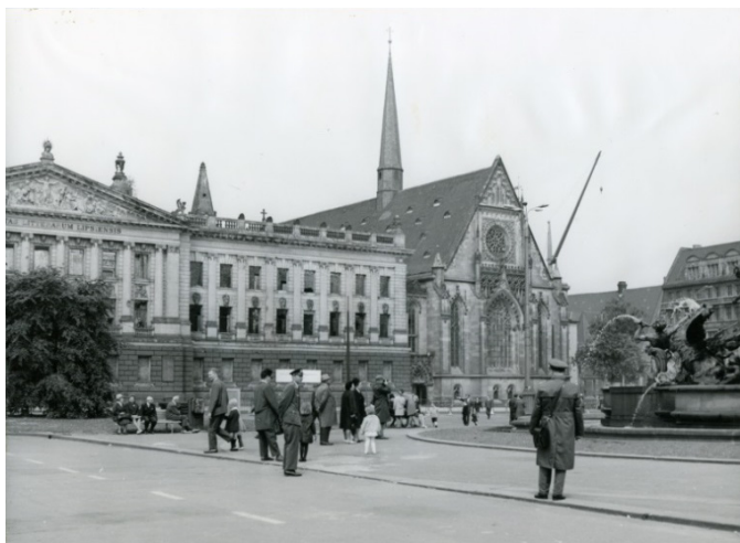
Die Universitätskirche Leipzig wenige Tage vor ihrer Sprengung am 30. Mai 1968

Am Tag der Archive geöffnet: 10:00 – 15:00 Uhr