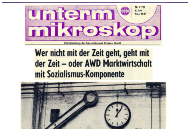
Ausschnitt aus der Betriebszeitung „Unterm Mikroskop“ des Arzneimittelwerkes Dresden GmbH 1990 (Sächsisches Wirtschaftsarchiv e. V.)

Am Tag der Archive geöffnet: 10:00 – 15:00 Uhr