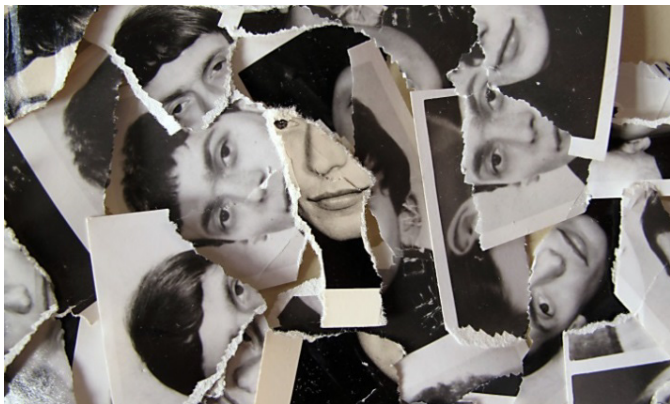
Durch die Stasi vorvernichtete Passfotos vom IM „Thomas“

Am Tag der Archive geöffnet: 10:00 – 18:00 Uhr