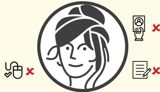
MARIELLA, 48, AUS VENEZUELA

Sie hat eine Ausbildungsduldung und darf wählen bei der Online-Wahl und kandidieren für die Online-Wahl (Säule 1) ODER sich bewerben im Bewerbungsverfahren (Säule 2).