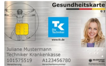
Карта медицинского страхования