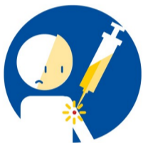
Болезненность в месте укола