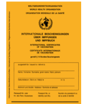
Карта прививок (Impfausweis)