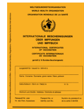
Thẻ tiêm chủng