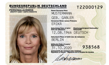
Thẻ căn cước, chứng minh thư

Nếu bạn không có thẻ ID, giấy căn cước và không có thẻ bảo hiểm, thì bạn có thể được tiêm vắc-xin ở một nhóm tiêm chủng, tiêm vắc-xin lưu động.