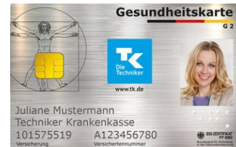
Thẻ được bảo hiểm