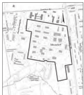
Geltungsbereich der FNP-Änderung für den Bereich „Parkstadt Dösen“ (fett umrandet) Kartengrundlage: Amt für Geoinformation und Bodenordnung

Stadtplanungsamt Dezernat Stadtentwicklung und Bau