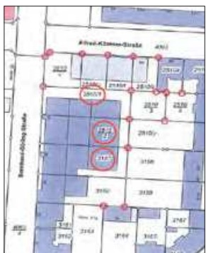
Auszug aus dem Liegenschaftskataster mit Eintragung des Baugrundstücks (mit Angabe der angrenzenden Flurstücke/Grundstücke einschließlich der Flurstücksnummern)

Gemäß § 70 Abs. 3 Sächsische Bauordnung (SächsBO) vom 28.05.2004 (SächsGVBl. 2004, S. 200) in der derzeit gültigen Fassung wird Folgendes bekannt gemacht: