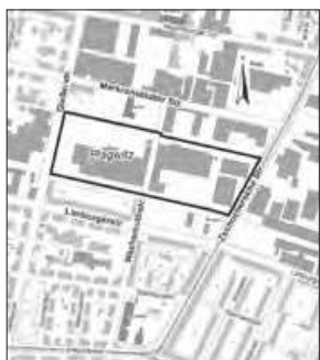
Geltungsbereich des Bebauungsplans Nr. 428.2, Gewerbegebiet Plagwitz Süd/Markranstädter Straße – Teil Süd „(fett umrandet) Kartengrundlage: Amt für Geoinformation und Bodenordnung

Hinweis: Das Stadtplanungsamt bleibt wegen Brückentag am 22.05.2020 geschlossen. Auch im Internet sind die Planunterlagen verfügbar: