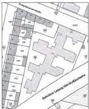
Auszug aus dem Liegenschaftskataster mit Eintragung des Baugrundstücks (mit Angabe der angrenzenden Flurstücke/Grundstücke einschließlich der Flurstücksnummern)