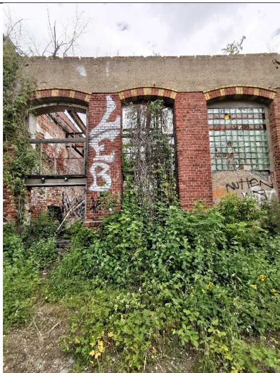
Abbildung 25: Klettergehölz 3