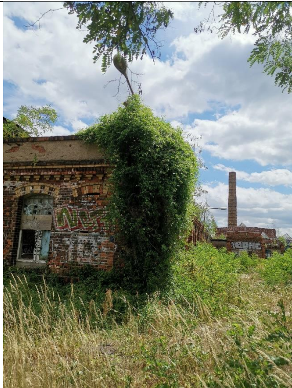
Abbildung 23: Klettergehölz 1