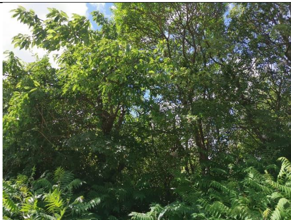
Abbildung 13: Baum 28