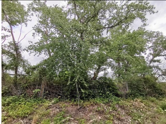
Abbildung 19: Bäume 45 – 50