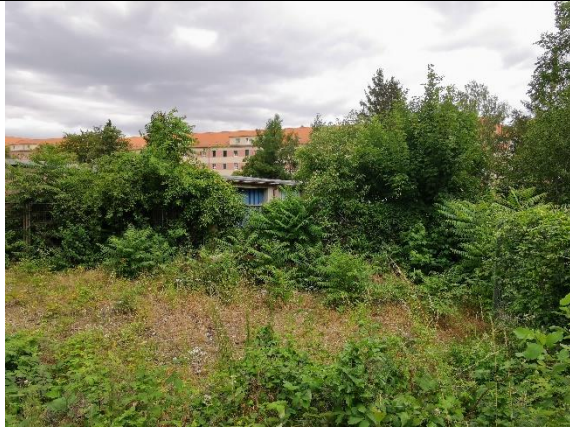
Abbildung 39: Wildwuchs 9