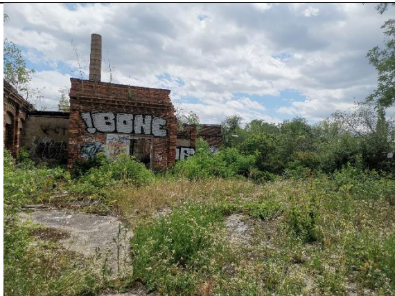
Abbildung 37: Wildwuchs 6