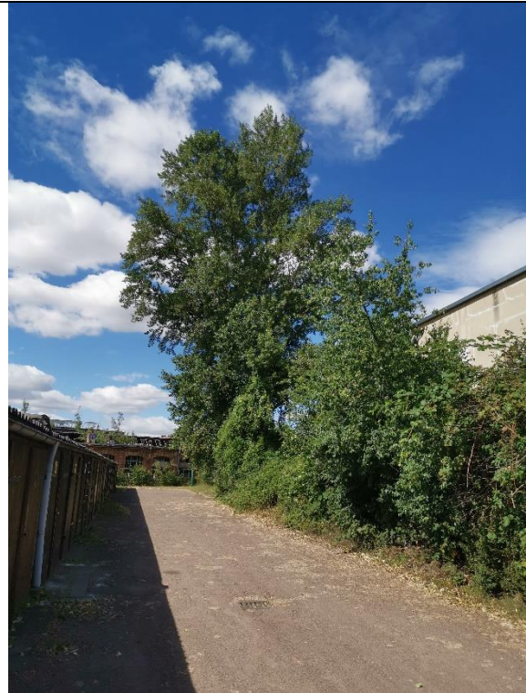
Abbildung 12: Bäume 25 – 26