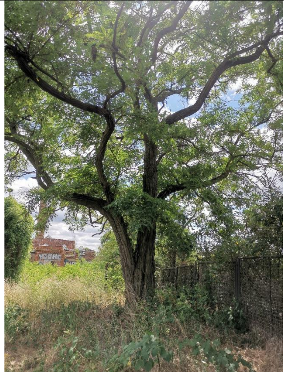
Abbildung 16: Baum 39