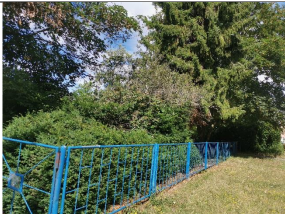
Abbildung 31: Strauch 8