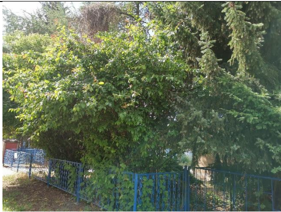
Abbildung 29: Strauch 3