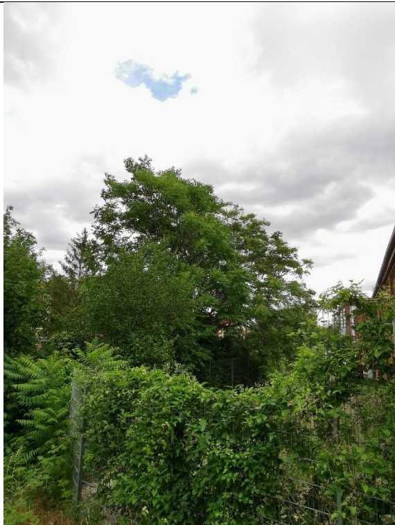
Abbildung 17: Baum 41