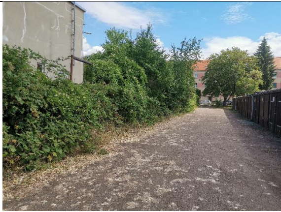
Abbildung 33: Wildwuchs 1