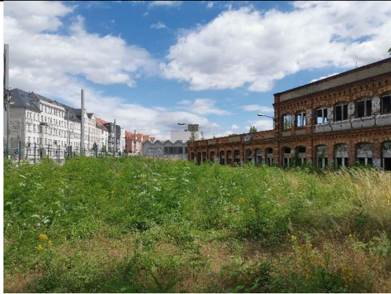
Abbildung 35: Wildwuchs 3