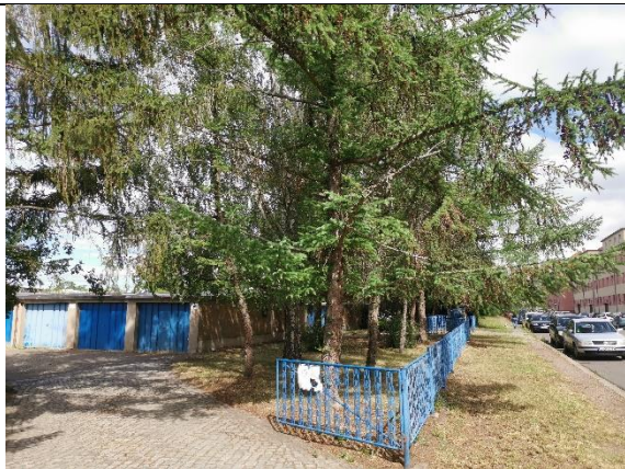
Abbildung 5: Bäume 8 - 15