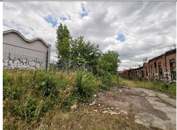
Abbildung 22: Baum 56