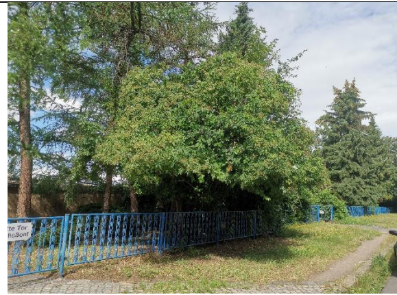
Abbildung 28: Strauch 2