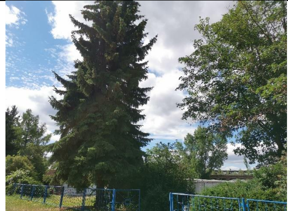
Abbildung 8: Bäume 21 - 22