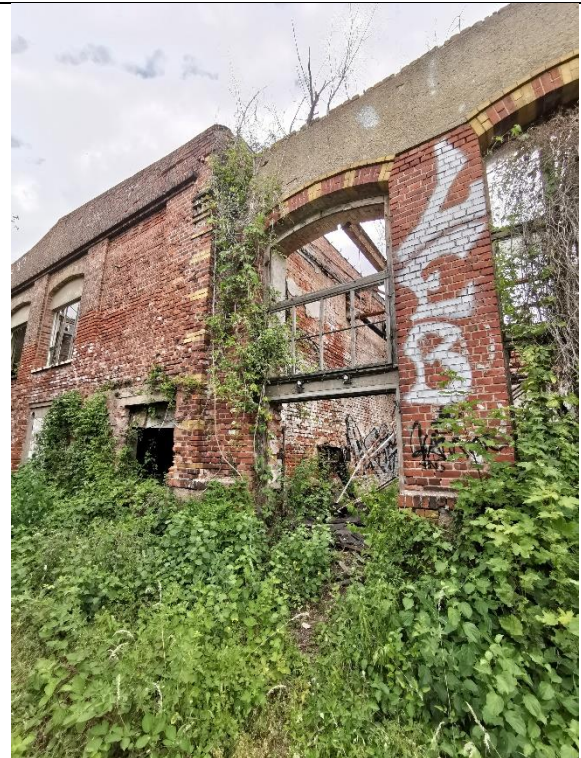
Abbildung 24: Klettergehölz 2