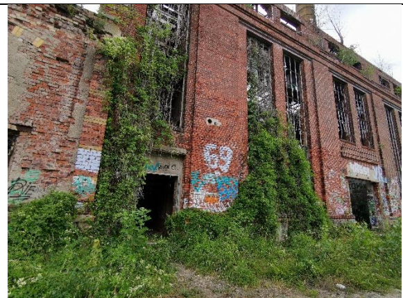
Abbildung 26: Klettergehölz 5 - 6