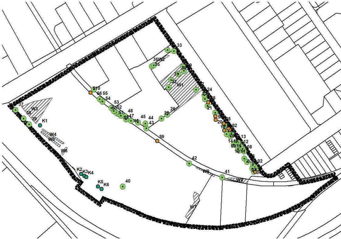
Abbildung 1: Gehölzplan

Für den Geltungsbereich des Vorhabenbezogenen Bebauungsplan Nr. 410 „Lützner Straße/Karl-Heine-Kanal“ wurde am 01.07.2020 eine Gehölzkartierung durchgeführt. Der Teilbereich C2 (s. Abbildung 2) blieb bei der Erhebung weitestgehend unberücksichtigt, da dort keine Änderungen des Bestands vorgesehen sind.