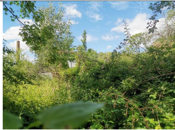
Abbildung 34: Wildwuchs 1