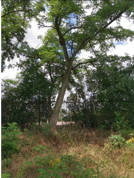
Abbildung 15: Baum 38