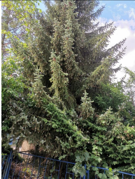
Abbildung 7: Baum 20