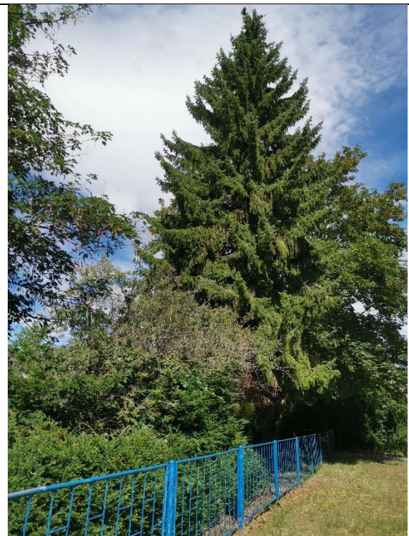
Abbildung 10: Baum 23