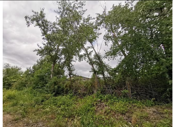
Abbildung 20: Bäume 50 – 52