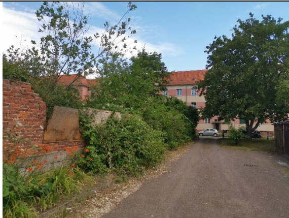
Abbildung 11: Baum 24