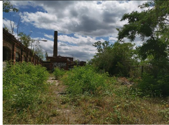
Abbildung 36: Wildwuchs 4 - 5