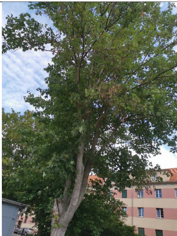
Abbildung 9: Baum 22