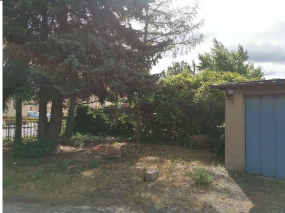
Abbildung 3: Bäume 1 - 5