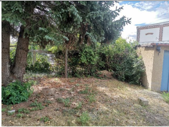
Abbildung 27: Strauch 1