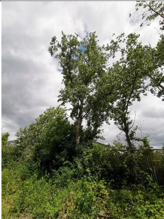
Abbildung 21: Baum 53