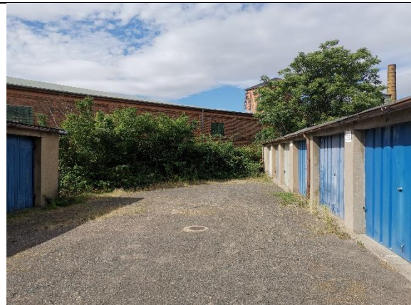
Abbildung 38: Wildwuchs 8