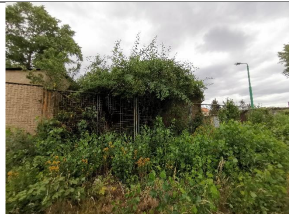
Abbildung 32: Strauch 9