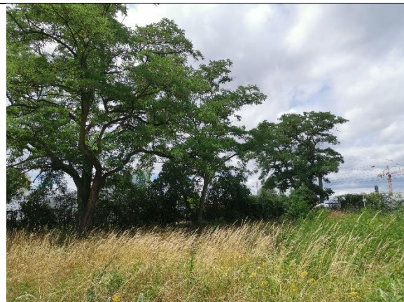
Abbildung 14: Bäume 37 – 39