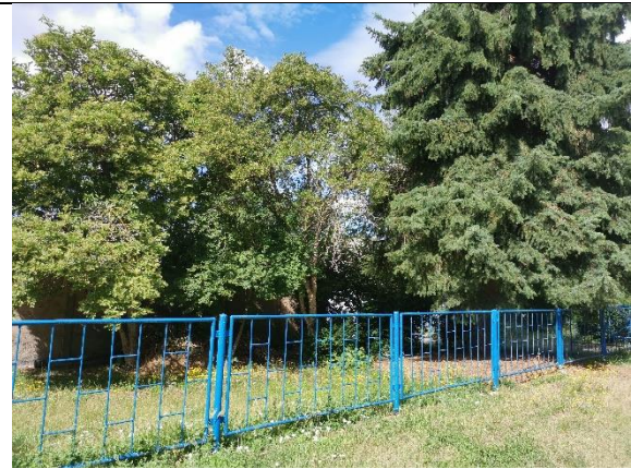
Abbildung 30: Sträucher 6 - 7