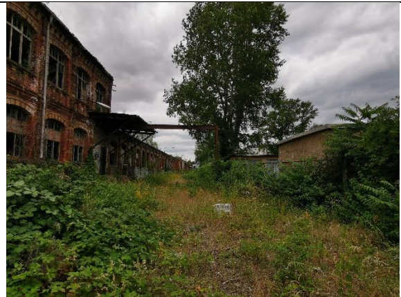
Abbildung 18: Baum 42