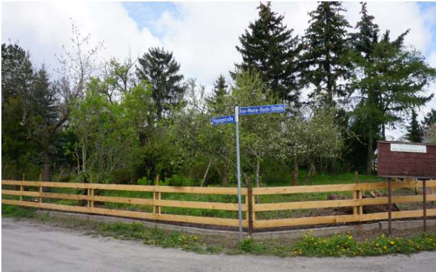
▲ Vorderansicht des Grundstücks